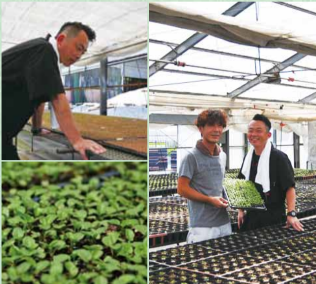
▲宇佐美さん（左）と下川さん（右）、二人とも3児のパパ。