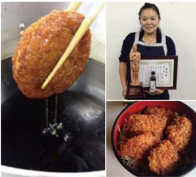
▲nantenのソースかつ丼にはもちろん使ってます！