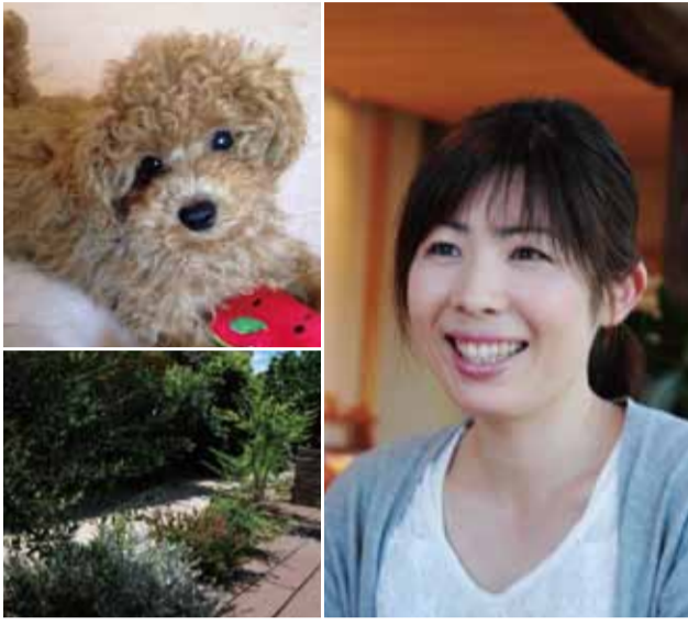
▲サロンの庭でとれたハーブをつかったりすることも・・・

http://www.sinwanet.co.jp/megumino_salon/